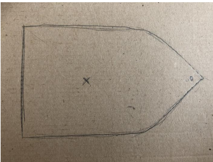
Obrázek 1: Základ z kartonu